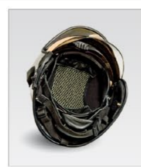
Einstellbares, antistatisches Kopfnetz

Reflektierende Helmaufkleber in den Farben: Silber Gelb Orange