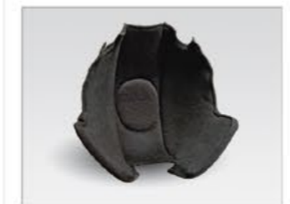
Weiches Komfortinnenfutter (abnehmbar waschbar und austauschbar)